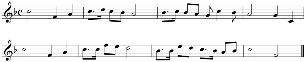
Образец слухового анализа